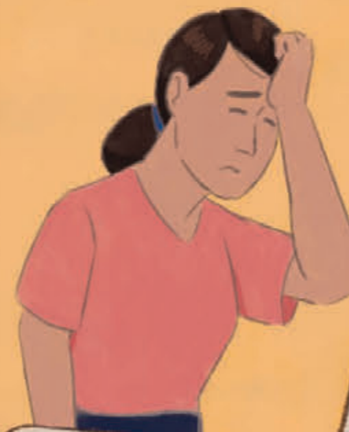
Anemia kurang darah