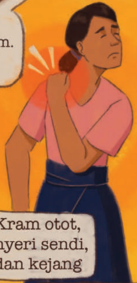
Kram otot, nyeri sendi, dan kejang