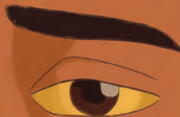
Penyakit kuning mata kuning