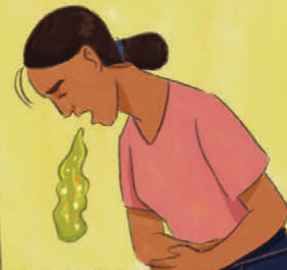
Mual dan muntah